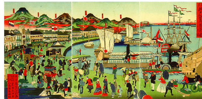
摂州神戸海岸繁栄之図