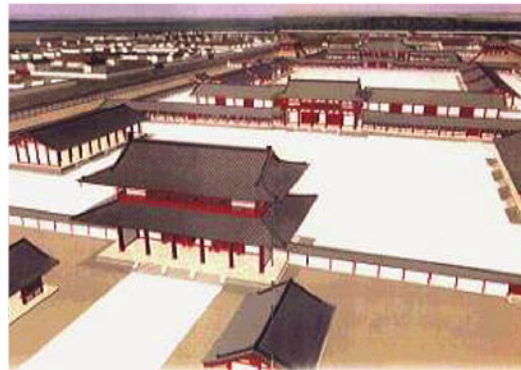
後期難波宮中心部の復元予想図