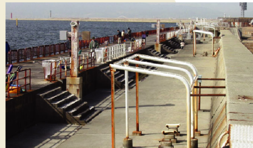
大阪南港魚つり園 (大阪市)

指導員の方が、海づり公園や魚つり公園で正しいマナーや魚の釣り方などを教えました。