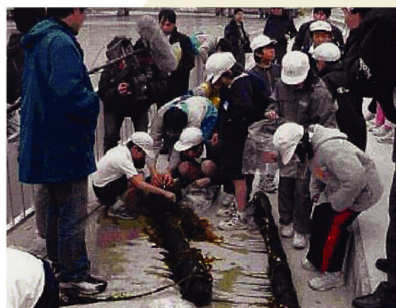
浜寺水路 (堺市・高石市)